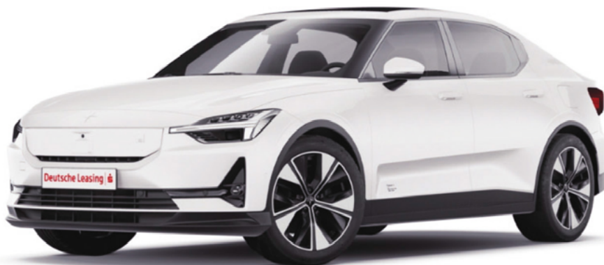
Abbildung ist beispielhaft, Abweichungen sind möglich.